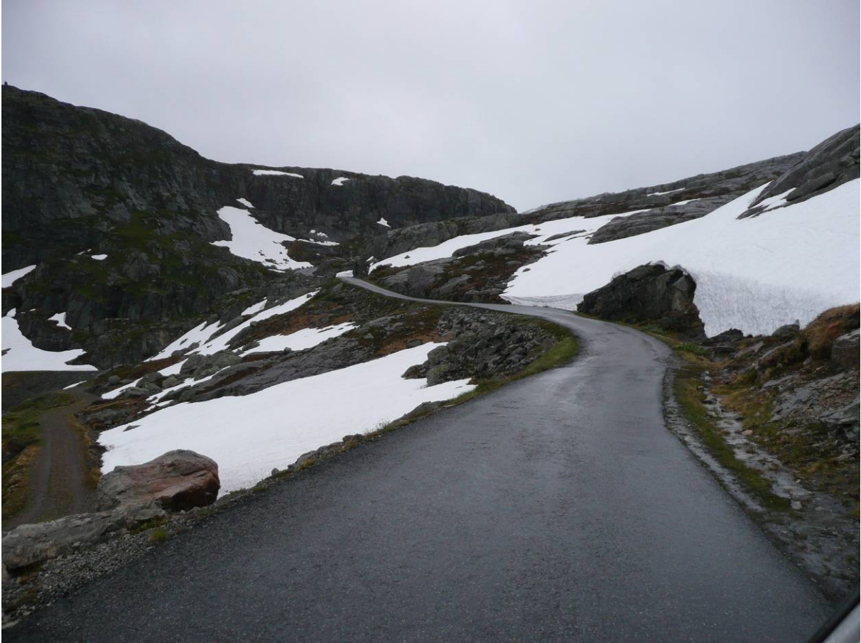
Straße von Jondal ins Folgefonna

Rundreise mit dem Womo durch Südnorwegen (Fjordnorwegen) / Reisetagebuch und Reisebericht