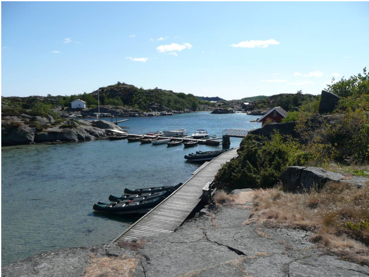
Campinganlage in Skottevik

Ungefähr eine halbe Stunde Fahrt östlich von Kristiansand finden wir einen schön an der Schärenküste gelegenen Campingplatz oder besser gesagt eine komplette Camping-Ferienanlage in Skottevik .