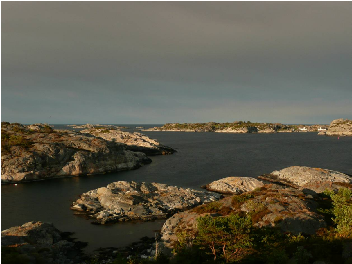
Schärenküste „hinter“ dem Campingplatz in Skottevik